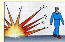
Опасная поза при взрыве